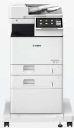
iR ADV DX 717/617/527