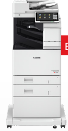
iR ADV DX C478