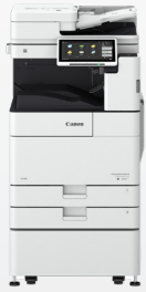
iR ADV DX 4700