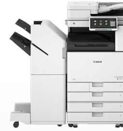
iR ADV DX C3700