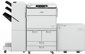
iR ADV DX 8700