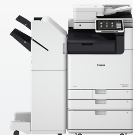
iR ADV DX C5800